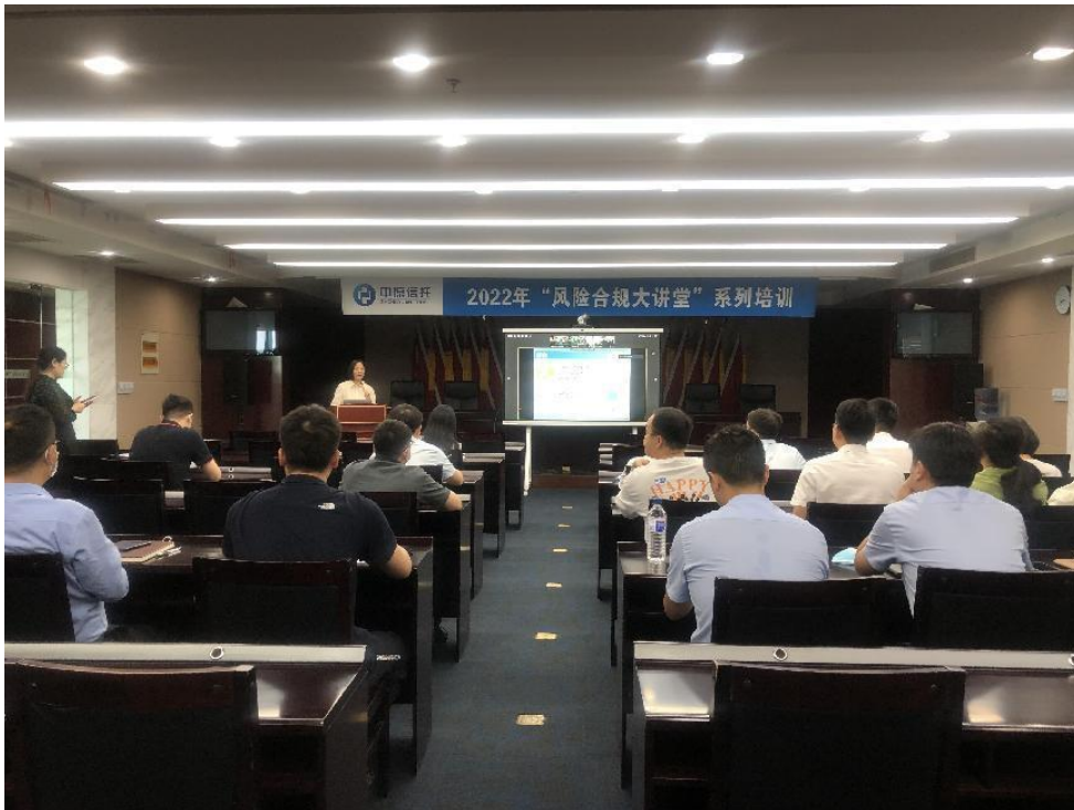
图 9: 2022 年 8 月-9 月，公司共组织了 3 期《风险合规大讲堂》专题培训，共 200 余名员工参与培训

业务赋能培训、保险金信托业务赋能培训等内部集中培训 16 期，组织外派培训项目 37 个，内容涉及业务及产品创新、风险合规运营、业务赋能等各个方面，年度参训总人次达到 1130 人次。同时，积极对接线上各类学习资源，通过线上学习平台持续提升员工专业能力。