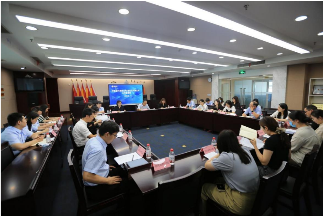
图 8: 2022 年 9 月，公司召开信托文化建设座谈会，各部门信托文化联络人参会 二是完善信托文化建设工作机制。建立信托文化联络人

一是积极践行高质量发展理念。按照“信托文化确立年”工作要求，不断完善公司组织架构、制度体系和工作流程，确立有中国特色的信托文化理念，重点是积极顺应监管政策导向，把转变发展方式作为首要战略选择，通过理念宣导，推动员工把可持续发展基点放在业务转型创新上，坚定回归本源，重点拓展资产管理、资产服务和公益/慈善信托等业务，培育新的业务增长极。