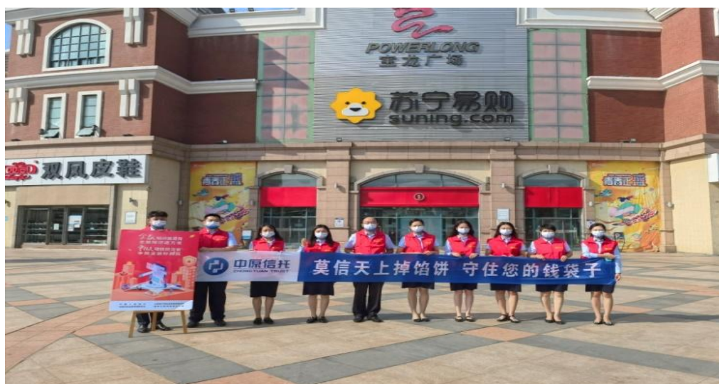
图 4：2022 年 9 月，公司组织开展金融知识进万家宣传

二是不断提升服务能力。公司以信托业务分类调整为契机，持续完善产品体系，推出涉及债券投资、股票多头、量化选股、CTA、结构化、固收+等多种策略不同系列的创新类产品，家族信托、家庭信托、保险金信托等财富管理受托服务信托稳步发展，为客户进行多样化、个性化资产配置选择提供产品支持。2022 年公司证券投资类产品存续规模突破 110 亿元，家族信托业务存续规模近 30 亿元，家庭信托、保险金信托等新业务实现“零”的突破，切实满足了社会和人民多样化的金融服务需求。