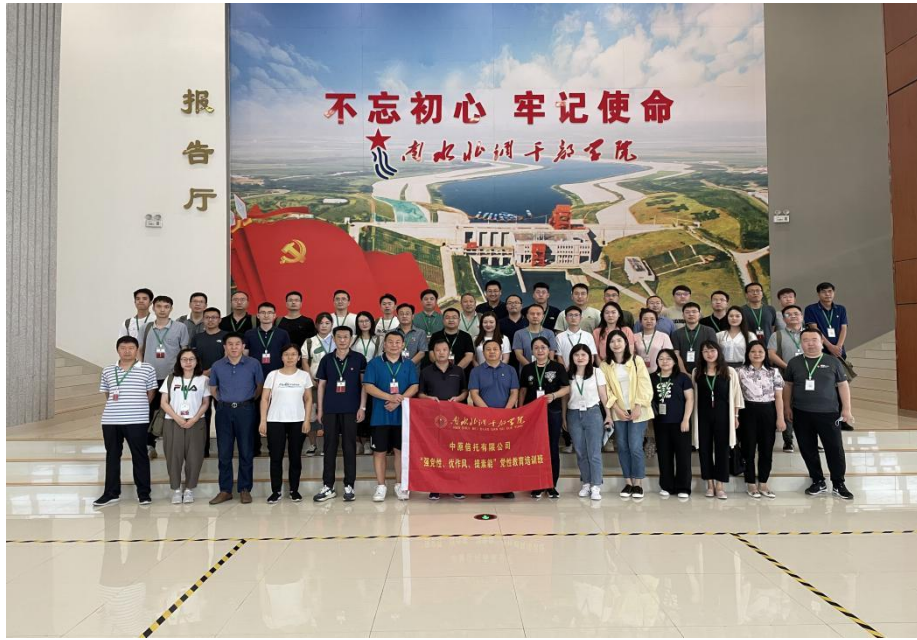
图 2: 2022 年 8 月, 公司在南水北调干部学院举办“强党性 优作风 提素能”党性教育培训班

二是全面加强党的建设。公司党委认真落实“第一议题”制度，全年开展 20 次集体学习，党委理论学习中心组开展 12 次学习，围绕 13 个专题深入研讨；组织党员干部深入学习党的创新理论，开展专题培训班 5 次，参训 350 余人次，150 名党员分 3 批前往南水北调干部学院接受党性教育；面向全体员工开展“党的创新理论宣讲比赛”，荣获河南省政府国资委颁发的优秀组织单位奖。全年召开 23 次党委会议，审议 108 项议题，对 32 项重大经营管理事项进行前置研究，确保党委在公司治理过程中发挥领导核心作用。建立业务、党建、合规“三套责任”考核体系，修订完善《党建工作责任制考核办法》，把党的领导体现在公司发展各方面，推动党建与业务深度融合。