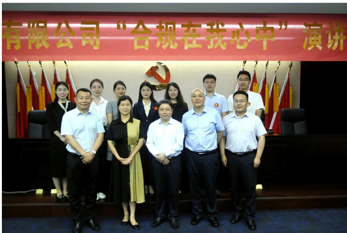
图 7：2022 年 6 月，公司举办“合规在我心中”演讲比赛

四是加强合同管理和放款要素审核。修订《合同管理办法》，优化流程设置，堵塞管理漏洞，强化合同质量管控。完善《放款要素审核办法》，将二级审批项目纳入审核范围，推动放款考核评价机制落地实施。