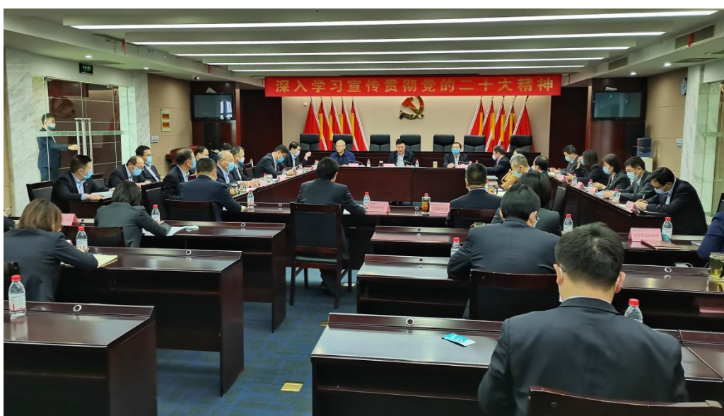
图 1：2022 年 11 月，公司召开党委会（扩大）会议，安排部署学习贯彻党的二十大精神工作

一是深入贯彻落实党的二十大精神。公司党委扎实推动党的二十大精神学习宣传贯彻工作，党委班子通过 4 次“第一议题”和 2 次党委理论中心组深入学习，先后 3 次向各党支部布置具体任务推动全面学习。河南省政府国资委党的二十大精神宣讲团率先在公司开展宣讲，引导党员、干部深刻领会党的二十大精神提出的新论断、新战略，贯彻新发展理念，融入新发展格局，培育公司新的竞争力。