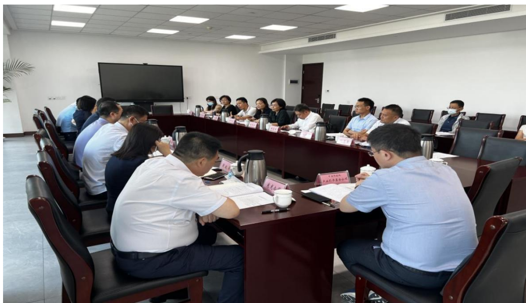
图 3：2022 年 7 月，公司赴郑州郑东新区管委会调研，共话科技型企业金融服务创新模式

一是以专业化改革为方向，实现部门职能和组织架构的快速调整，相继组建了证券组合投资部、家族信托办公室、证券信托业务部、股权投资业务部和资产证券化部等相关专业化团队，重点探索股权投资、资本市场、资产证券化、财富管理等领域业务机会，提升服务国家战略的专业化能力。