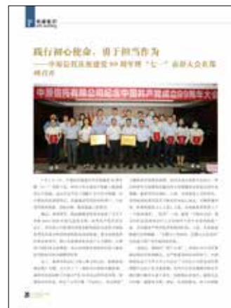
20 践行初心使命，勇于担当作为