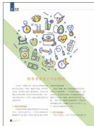
36 秋冬季养生十个小常识