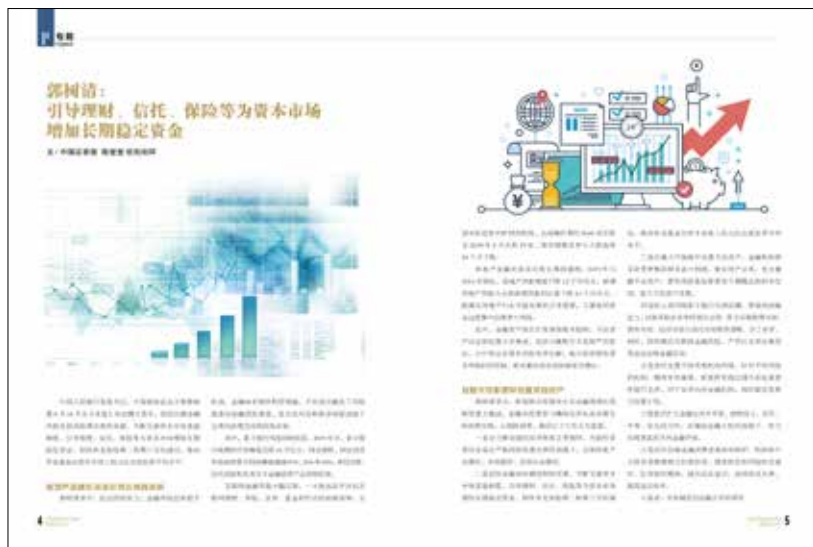
04 郭树清: 引导理财、信托、保险等为资本市场增加长期稳定资金