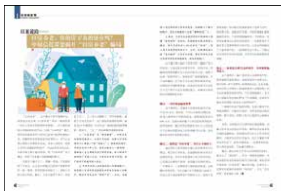
42 以房养老，你的房子真的还在吗？中原信托带您揭开“以房养老”骗局